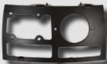
DF-24: рама каркаса купола