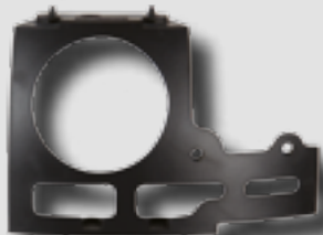
DF-23: рама каркаса купола